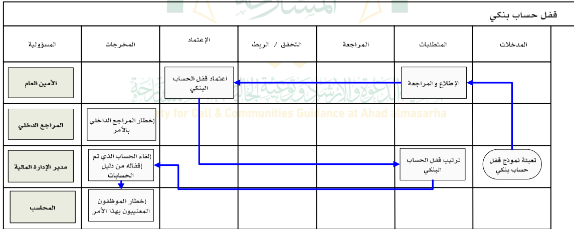
شكل رقم / ٢

يوضح المخطط البياني التالي ( شكل رقم / ٢ ) طريقة تسلسل العمل لقفل حساب بنكي: